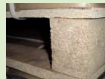
④パーティクルボード (particleboard) を使用したパレット