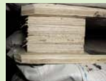
②合板 (plywood) を使用したパレット