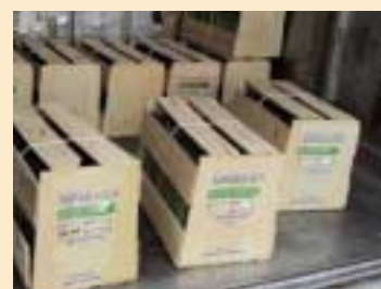
⑥木製の木枠、すかし箱、クレート (wooden crate)