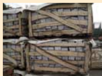
④木製の木枠、すかし箱、クレート (wooden crate)