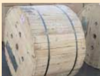
②木製のドラム (wooden drum)