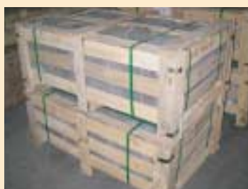
⑤木製の木枠、すかし箱、クレート (wooden crate)