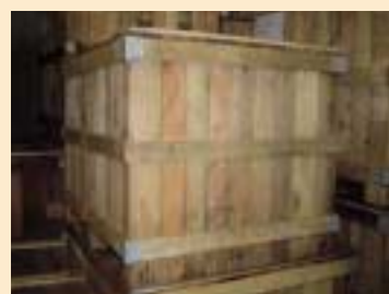
⑦木製木箱 (wooden case)