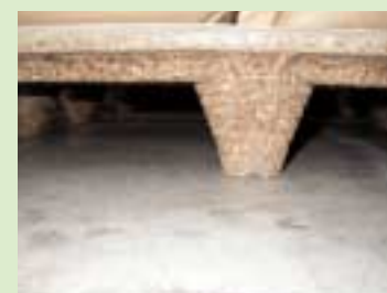
③パーティクルボード (particleboard) を使用したスキッド