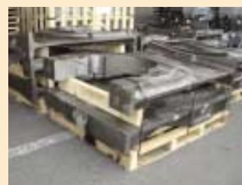
⑨木製のパレット+当て木