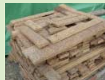
⑤パーティクルボード (particleboard) を使用したダンネージ