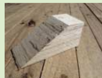
①LVL (laminated veneer lumber) を使用したクサビ(留め木)