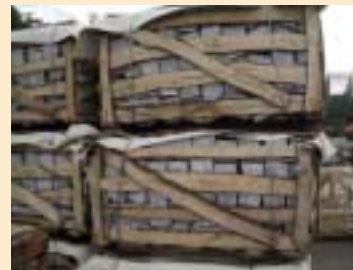
④ 木框, 木条箱, 格子箱(wooden crate)