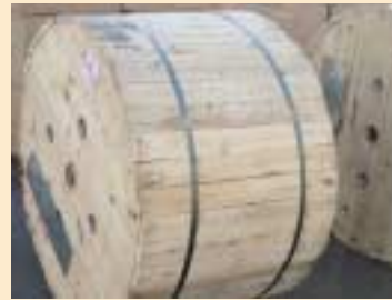
② 木制桶(wooden dram)