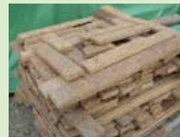
⑤ 采用硬质纤维板(particleboard)的垫板