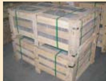
⑤ 木框, 木条箱, 格子箱(wooden crate)