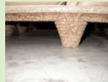
③ 采用硬质纤维板(particleboard)的垫木