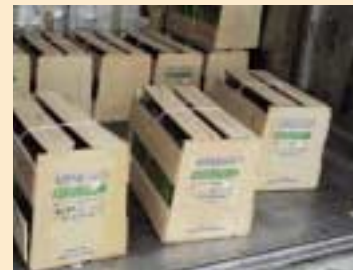
⑥ 木框, 木条箱, 格子箱(wooden crate)