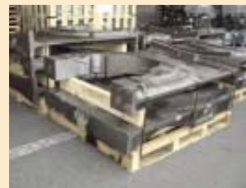
⑨ 木制托板 + 拦木