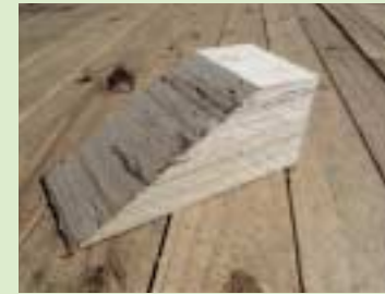
① 采用LVL(laminated veneer lumber)的楔子(档木)