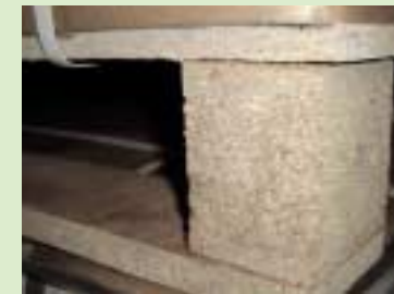
④ 采用硬质纤维板(particleboard)的托板