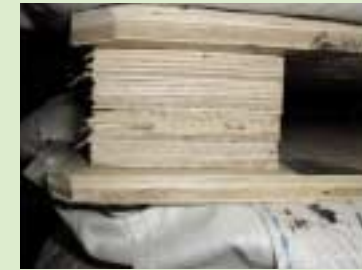
② 采用胶合板(plywood)的托板